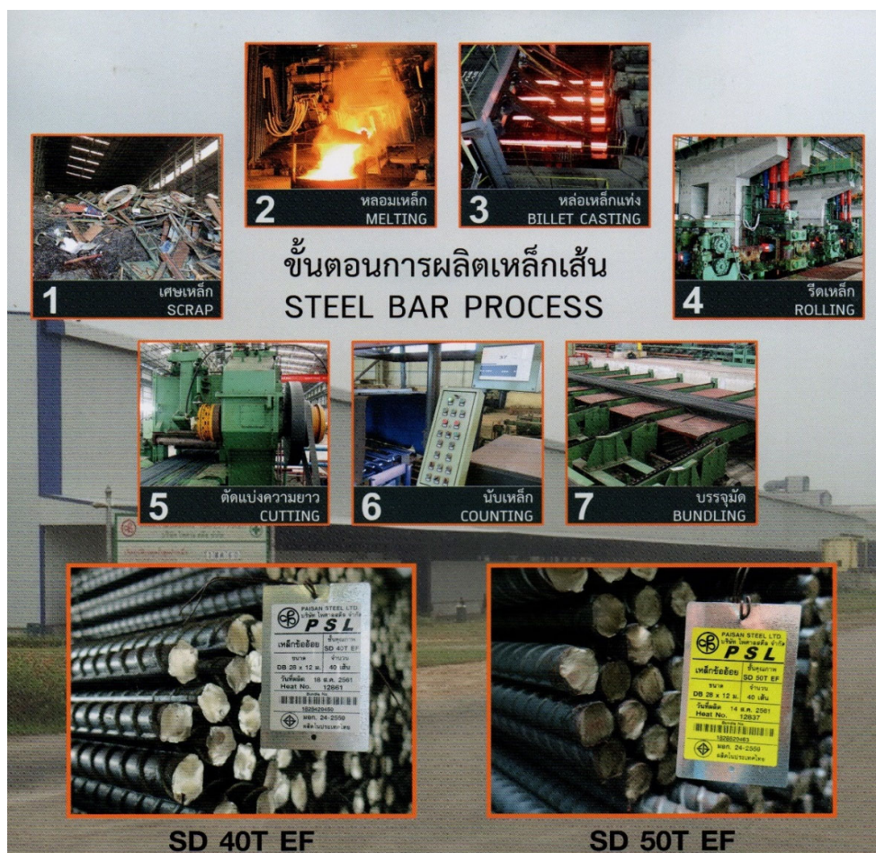
ภาพที่ 1.4 กระบวนการผลิต

โครงการมีการผลิตหลอมและหล่อเหล็กแท่ง จำนวน 2 สายการผลิต ซึ่งมีเตาหลอมทั้งหมด 2 เตา ขนาด 50 ตัน/เตา และมีการใช้พื้นที่แบ่งเป็น 4 แผนก ตามขั้นตอนหลักในการผลิต ได้แก่ 1) แผนกเตรียมเศษเหล็ก, 2) แผนกหลอมเหล็ก, 3) แผนกหล่อเหล็กแท่ง และ 4) แผนกจัดเก็บผลิตภัณฑ์ ซึ่งปัจจุบันดำเนินการผลิต เพียง 1 เตาหลอมในสายการผลิตที่ 1 และสายการผลิตที่ 2 ยังไม่เปิดดำเนินการ